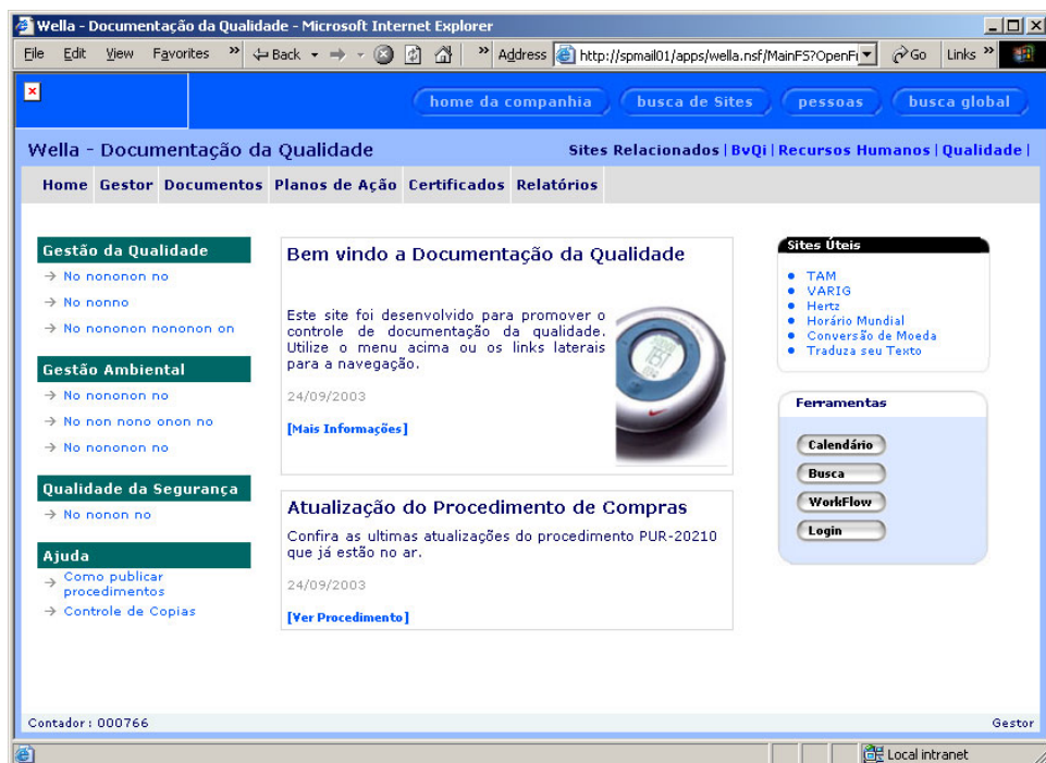
Tela Principal do Sistema

O gerenciador de interface Web permite a integração com a sua Intranet, fazendo com que o Acrobyte Wella se torne mais um site da Intranet da companhia e até mesmo o usuário, gestor do sistema, pode se encarregar de alterar menus, links e notícias do site, sem depender do pessoal técnico.